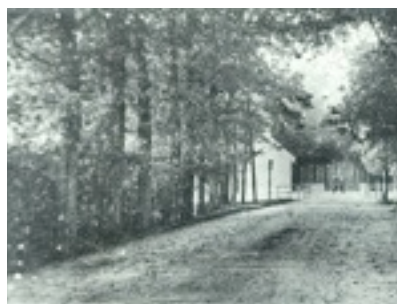
Spoelderbärgbrugge naor Theetuun Thijssen