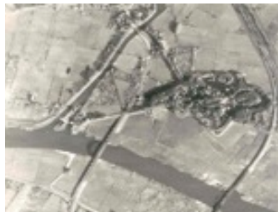
Vestingwärk 't Engelse Wärk